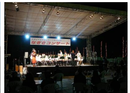
大テント（11820×8520×H5400）、ステージ（5400×7200×H900）