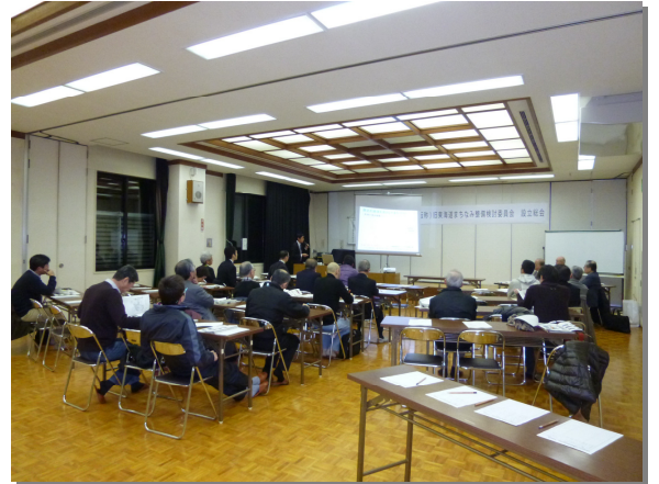
△ 旧東海道まちなみ整備検討委員会設立総会