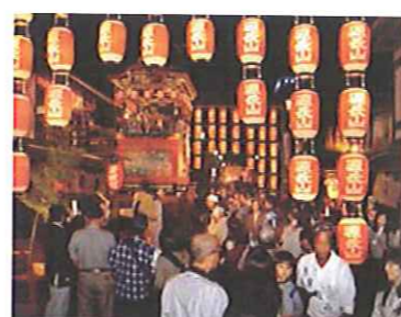
宵宮の大吊り灯り