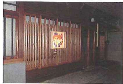
寺町通りに展示した木枠灯り

内容：籤取り式から始まる10日間の祭り囃子の練習期間と宵宮には、各曳山町のちょういえには、祭り提灯が輪灯される。また、まちなかの庇下にも献灯提灯が吊され、伝統文化の灯りを楽しめる。