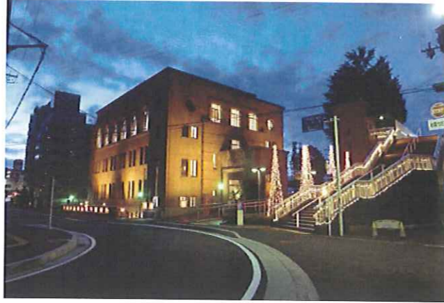
ライトアップの参考写真

内容：昭和初期に建てられた近代建築で、登録有形文化財でもある、旧大津公会堂をライトアップし、普段と異なる表情を魅せることで、品格あるまちなみを感じる。