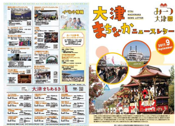
「大津まちなかニュースレター」 (D3版 4ページ 53,750部発行)

○ パンフレットや、ガイドブックにおいて、「大津まちあるき」や「大津百町まちあるきマップ」の情報発信を行いました。