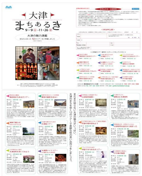
「大津まちあるき」チラシ (A3版 15,000部発行)