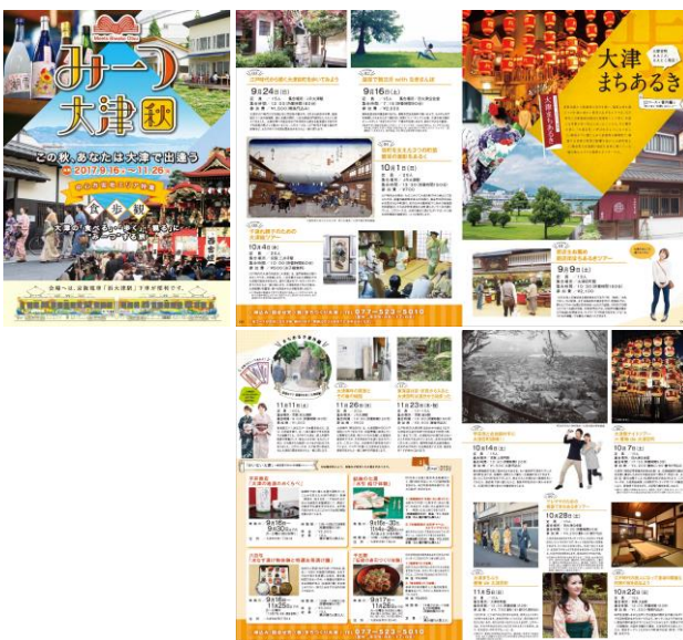
「みーつ大津・秋」パンフレット

○ パンフレットや、ガイドブックにおいて、「大津まちあるき」や「大津百町まちあるきマップ」の情報発信を行いました。