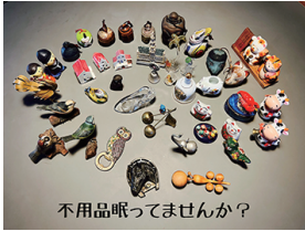
不用品眠ってませんか？

家にある捨てるのはもったいない古い物を持って大津百町スタジオへ遊びに来て下さい 物々交換のように不用品でハーブティーやお茶をどうぞ。品物によってお菓子が付きますよ♪ 価値のあるものはお小遣いになるかも?! 家にある古い物、海外で買った又はもらった使わないお土産などの不用品をお持ち下さい。